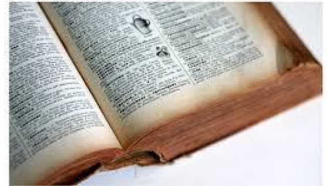
101 ans de service et ce n'est pas fini